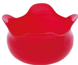
パンクックボウル