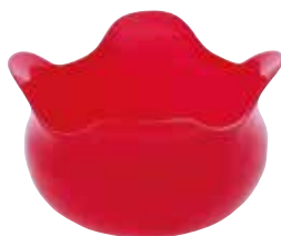
パンクックボウル