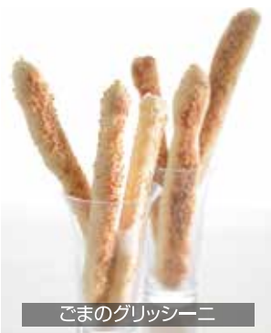
ごまのグリッシーニ