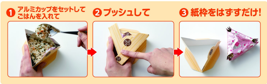
おにぎらないホイル工程画像