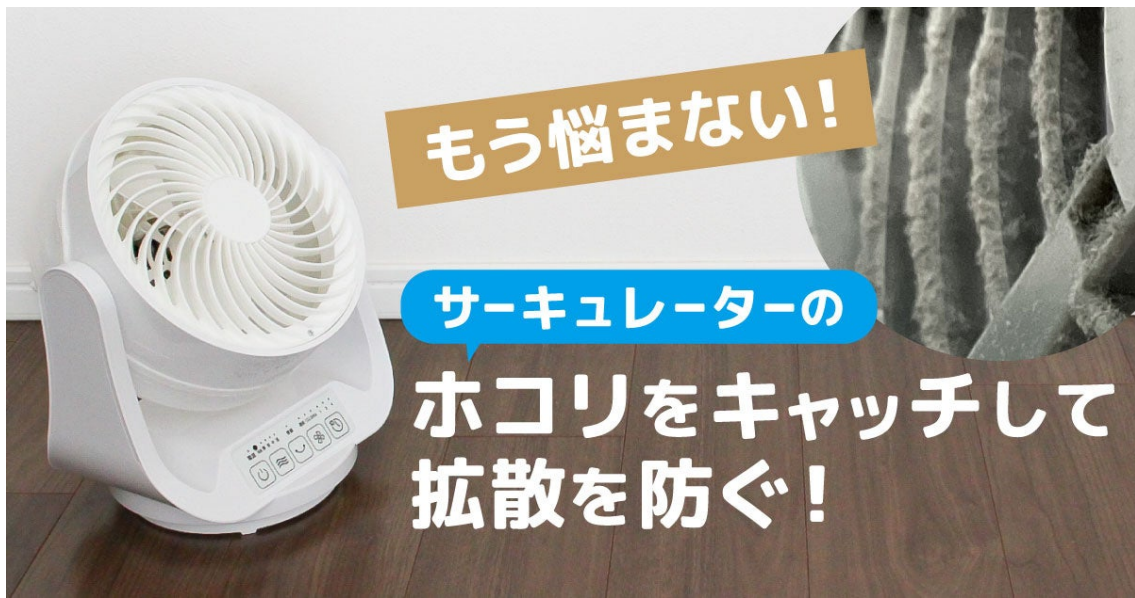
ホコリとりフィルター サークュレーター用