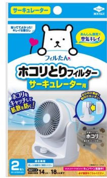
ホコリとりフィルターサーキュレーター用

オンラインショップ： https://item.rakuten.co.jp/toyalekco/254461/