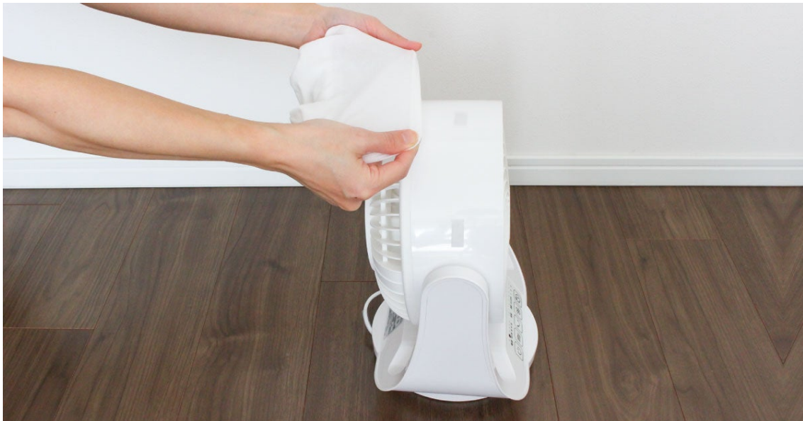
ホコリとりフィルターサーキュレーター用取付けシーン

商品詳細ページ： https://www.toyoalumi-ekco.jp/products/for_appliance_03/