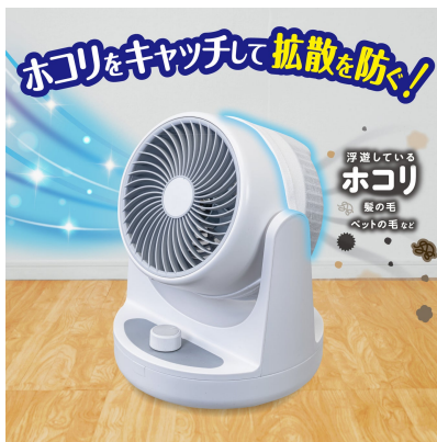
空気キレイ イメージ